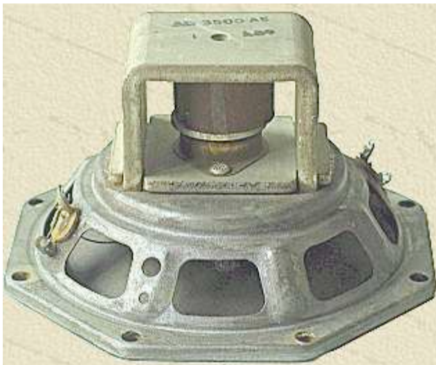
Philips AD3500AE, 1959, middentoon speaker, de conus is verstijfd met een geribbeld stukje textiel ->